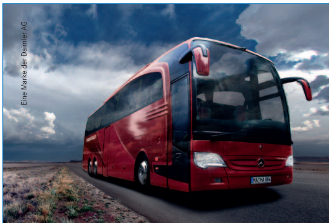
Eine Marke der Daimler AG

Konzeption: Darstellung des Themas, Experten-Statements mit anschließender Podiumsdiskussion. Dabei treffen gegensätzliche Meinungen aufeinander. Die offene Diskussion, die darauf folgt, stellt den Dialog von Fachbesuchern und Podium her.